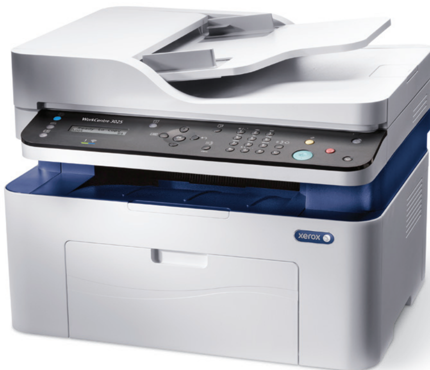
WorkCentre 3025: kopírování, tisk, skenování, faxování.*

* Fax a automatický podavač dokumentů jsou k dispozici jen se zařízením WorkCentre 3025NI.