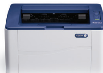
Phaser 3020: tiskárna.