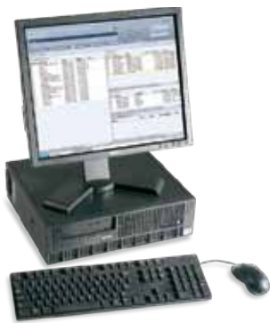
Kontroler Xerox® FreeFlow®

Každý kontroler je navržen tak, aby splňoval konkrétní sadu požadavků workflow a aplikací. Při výběru nejvhodnějšího kontroleru vám pomůže místní zástupce společnosti Xerox.