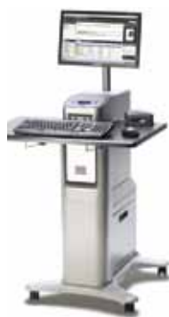
Kontroler Xerox® EX, Powered by Fiery®*