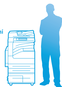
WorkCentre 5335 s Velkokapacitní tandemový zásobník