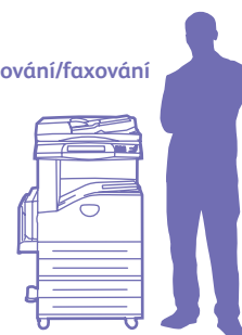
WorkCentre 5222 s jednotkou se dvěma zásobníky