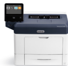
Tiskárna Xerox® VersaLink B400