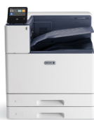
Barevná tiskárna Xerox® VersaLink C8000