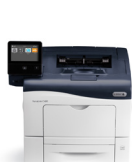
Barevná tiskárna Xerox® VersaLink® C400