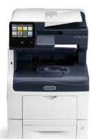
Barevná multifunkční tiskárna Xerox® VersaLink C405