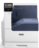
Barevná tiskárna Xerox® VersaLink C7000