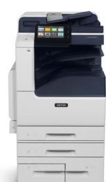
Multifunkční tiskárna Xerox® VersaLink B7125/B7130/B7135