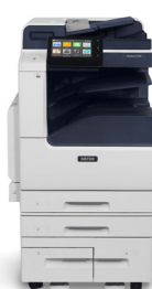
Barevná multifunkční tiskárna Xerox® VersaLink C7120/ C7125/C7130