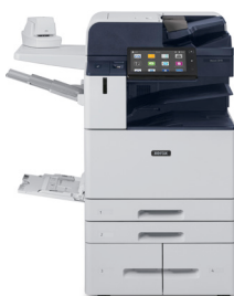
Barevná multifunkční tiskárna Xerox® AltaLink® C8130/ C8135/C8145/ C8155/C8170