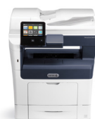
Multifunkční tiskárna Xerox® VersaLink B405