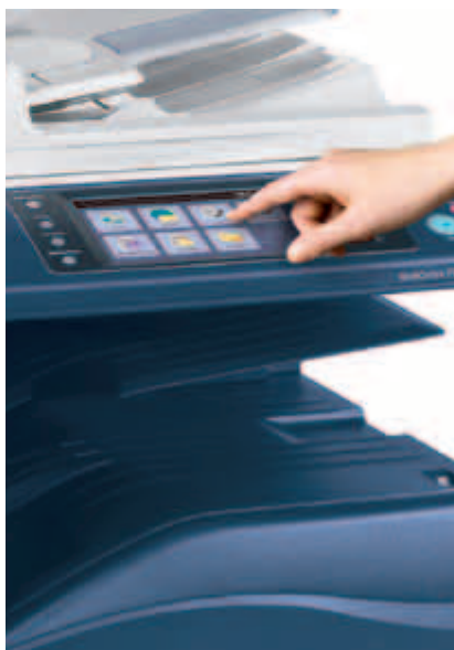
Přizpůsobená řešení v rámci rozhraní dotykové obrazovky EIP.

Následují jen dva příklady možných řešení Xerox Workflow Solutions.