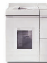
Jednotka základního finišeru