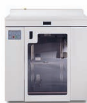
Velkokapacitní stohovač Xerox DS5000