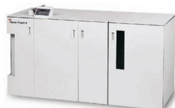
Zařízení pro děrování GBC Fusion Punch II s odsazovacím stohovačem