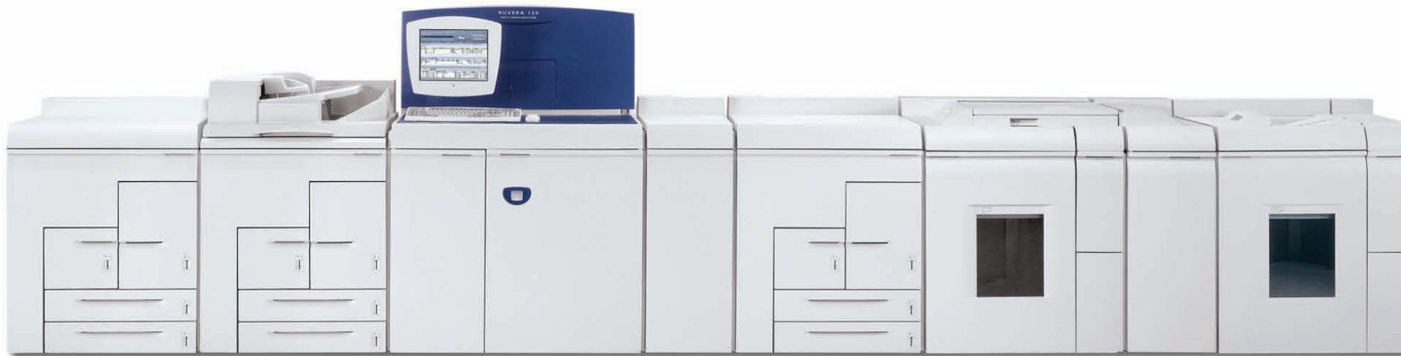
Produkční systém Xerox Nuvera® 100/120/144 EAQ s profesionálním RIP serverem FreeFlow®, integrovaným skenerem, rozšířenou hustotou rastru, dodatečným prokládáním, inline stohováním a sešíváním