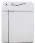
Transportní modul dokončovací jednotky