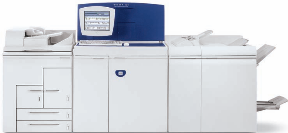
Xerox Nuvera® EA se standardním RIP serverem FreeFlow®, integrovaným skenerem, profesionálním multifunkčním finišerem Plus

Dokončovací zpracování může vaše aplikace pozdvihnout, nebo jim uškodit. Produkční systém Xerox Nuvera® 100/120/144 EA vám nabízí mnoho způsobů jak zpracovat váš výstup – a vytvářet kvalitní, působivé aplikace přímo tam, kde potřebujete.