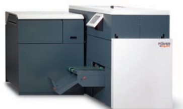
C.P. Bourg (Watkiss) PowerSquare™ 200