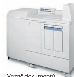
Vazač dokumentů Xerox DB120-D