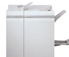
Multifunkční profesionální finišer Plus

Nabízí všechny výhody jednotky základního finišeru Plus a hladce s ním spolupracuje, a navíc přidává výhodu architektury Document Finishing Architecture (DFA), což je vaše brána k alternativním inline finišerům. Jednotka BFM-DC nabízí přímé připojení k finišerům s centrální registrací, jako je jako je jednotka pro páskou vázané knihy a manuály Xerox Tape Binder, zařízení C.P.Bourg (Watkiss) PowerSquare™ 200, CEM DocuConverter™ a další.