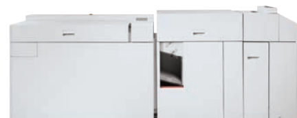
Zařízení pro tvorbu brožur Xerox Squarefold®