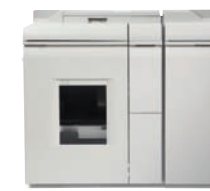
Jednotka základního finišeru Plus