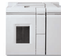
Jednotka základního finišeru – Direct Connect