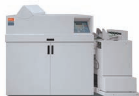
Zařízení pro tvorbu brožur s SquareFold hřbetem C.P. Bourg BDFx Booklet Maker