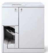
Jednotka Xerox Tape Binder pro páskou vázané knihy a manuály