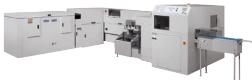
Zařízení C.P. Bourg Manual and Book Factory s řezačkou Challenge Machinery CMT 330 3 Knife Trim