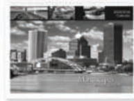
Děrování pro kalendářovou/spirálovou vazbu