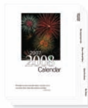
Rozřazovače s oušky