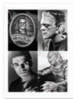
Složky nebo brožura V1