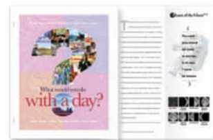
Barevné vložené listy, sešívání a skládání technických výkresů

Naše kopírka/tiskárna vám dává více možností. Vytvářejte nyní i v budoucnosti inovativní aplikace generující obchodní příležitosti.