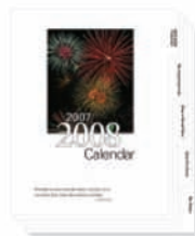
Rozřazovače s oušky