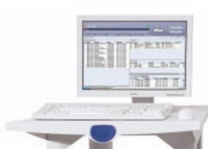
Rip tiskový server Xerox FreeFlow