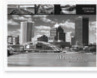
Děrování pro kalendářovou/ spirálovou vazbu