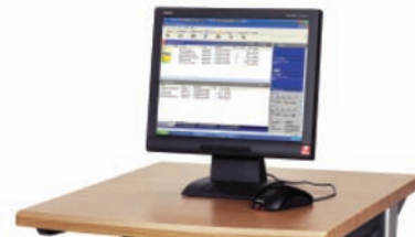
RIP tiskový server EX, powered by Fiery