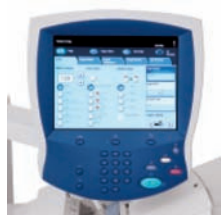
Integrovaný kopírovací/tiskový server