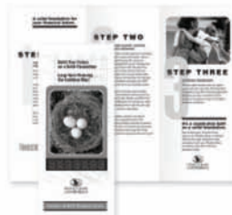
Dvojitý sklad, sklad ve tvaru „C“ a „Z“