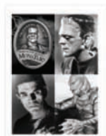
Složky nebo brožura V1